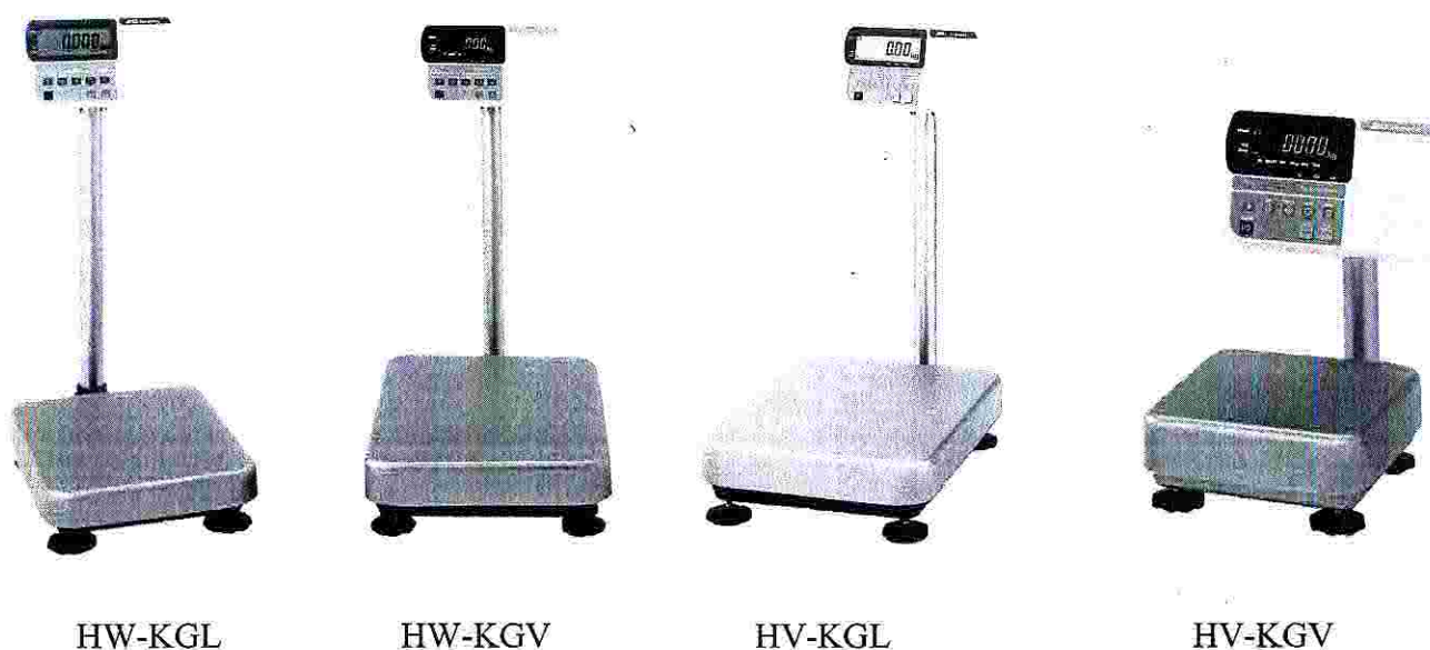
Рисунок 1 – Общий вид весов

Общий вид весов представлен на рисунке 1.