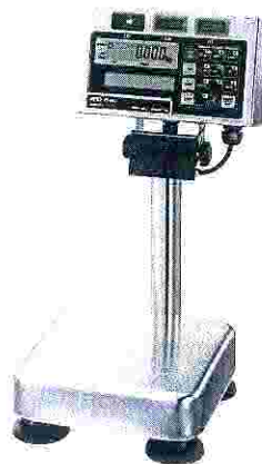
Рисунок 1 - Общий вид весов FS

Общий вид весов представлен на рисунке 1.